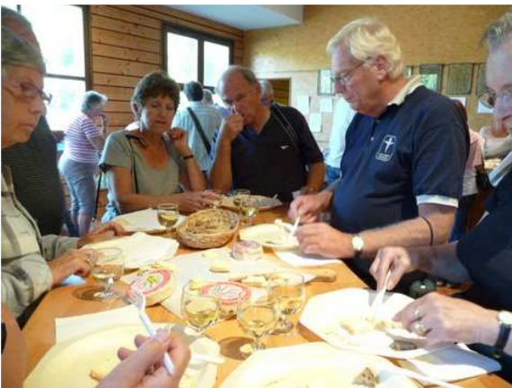
Lapoutroie – dégustation de munster

Ce séjour fut agrémenté de visites et dégustations dans une distillerie, une fabrique de munster, une cave vinicole et une chocolaterie. Les 41 personnes ont apprécié l'hôtel du Faudé à Lapoutroie où nous résidions, et tout particulièrement les repas avec les spécialités locales, accompagnés à chaque plat de vins d'Alsace différents. Le dernier apéritif nous a été servi dans la cave même du restaurant.