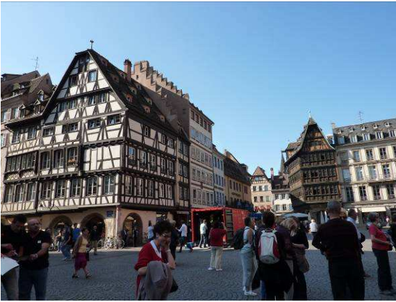
Strasbourg devant la cathédrale

Ce séjour fut agrémenté de visites et dégustations dans une distillerie, une fabrique de munster, une cave vinicole et une chocolaterie. Les 41 personnes ont apprécié l'hôtel du Faudé à Lapoutroie où nous résidions, et tout particulièrement les repas avec les spécialités locales, accompagnés à chaque plat de vins d'Alsace différents. Le dernier apéritif nous a été servi dans la cave même du restaurant.