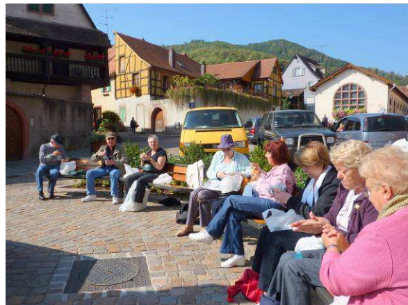
Ribeauvillé – pique nique