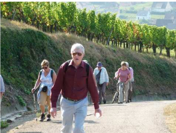
En chemin, dans les vignes